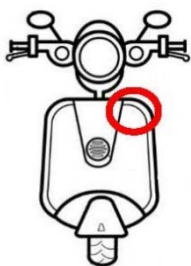
圓形機車證請貼於機車左前方