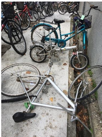
宿舍 S 館旁