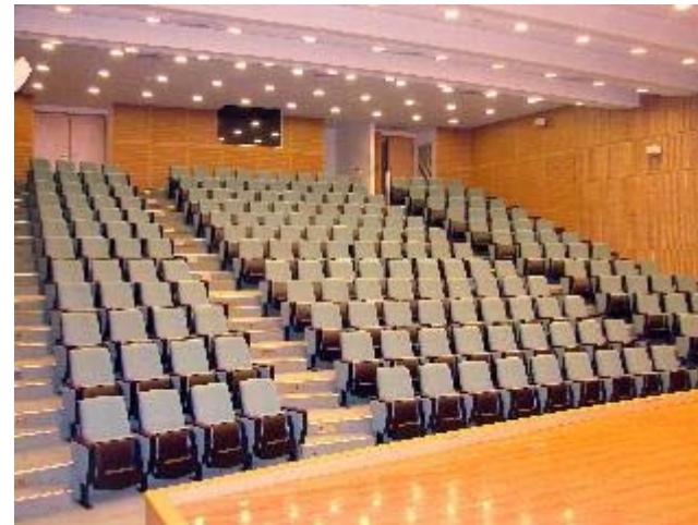
位於第一教學大樓B1