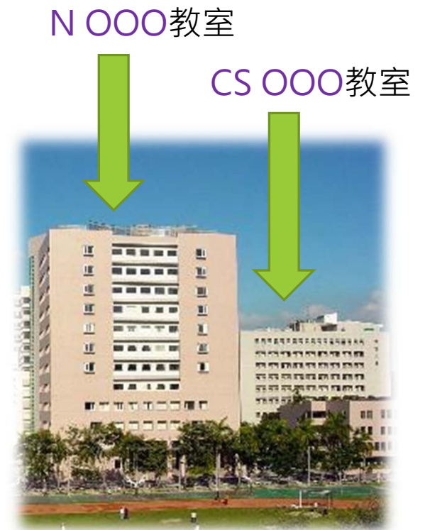
第一教學大樓/濟世大樓