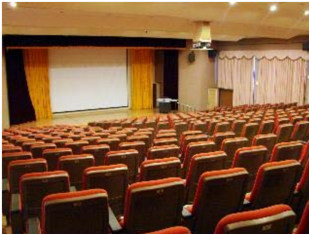
位於綜合實驗大樓1F旁