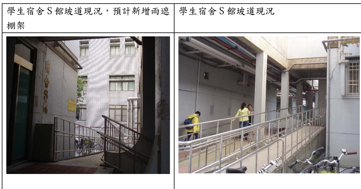
圖五：學生宿舍 S 館無障礙斜坡道雨遮棚架改善位置