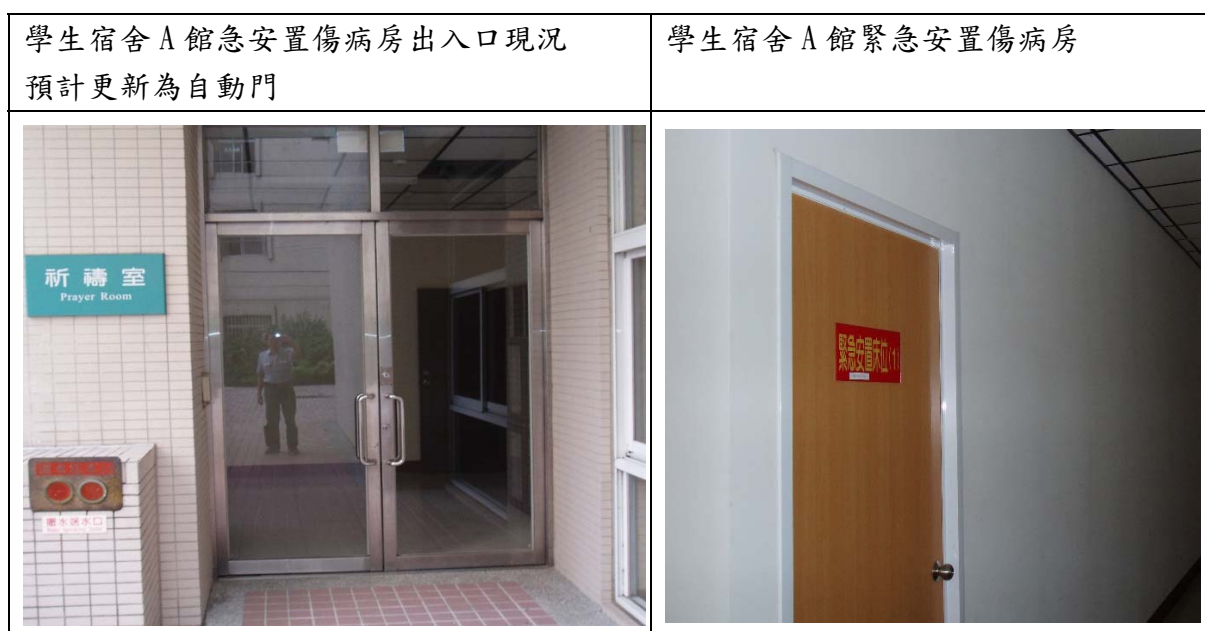
圖四：學生宿舍 A 館緊急安置傷病房自動門改善位置