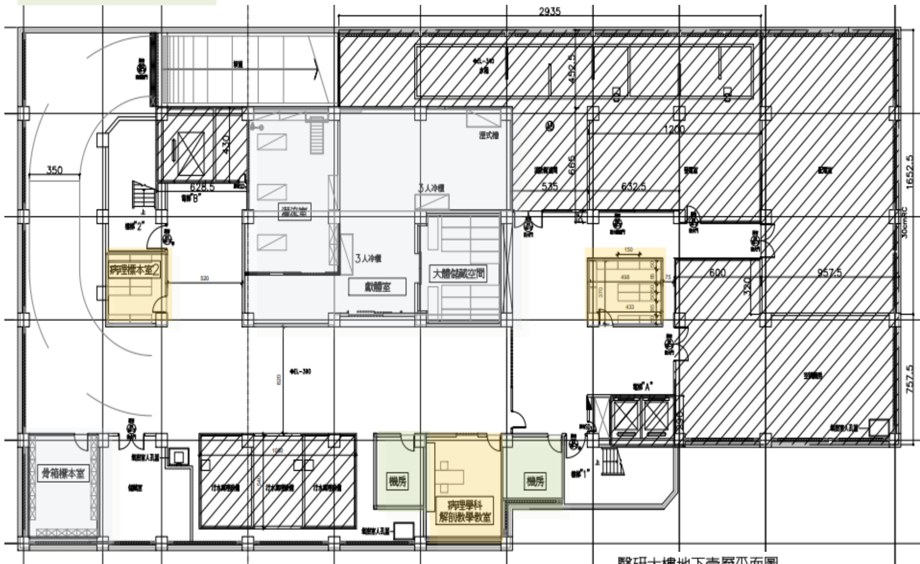
醫研大樓地下壹層平面圖